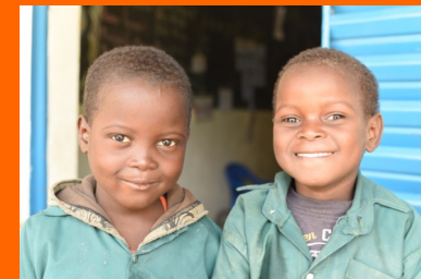
Foto voorkant: Tweeling op basisschool AECM. Lees hun verhaal bij laatste nieuws op: www.nigerzending.eu/nieuws