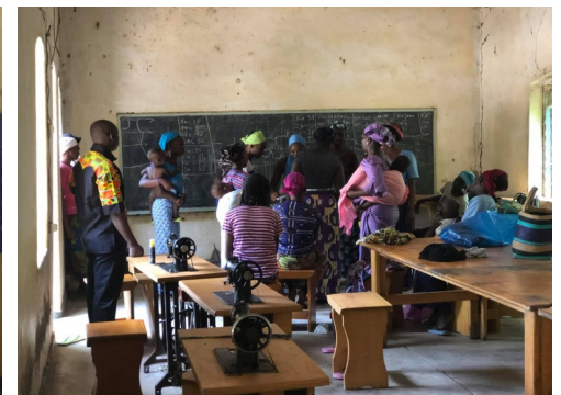
Les patroon tekenen.