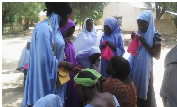
Een nieuwe groep ...

Dit lesmateriaal kregen we van Young Africa en we lieten dit vertalen in het Hausa. Het is materiaal waarmee we jonge mensen helpen na te denken over wie ze zijn, over wat ze willen in het leven en over hoe ze voor zichzelf op kunnen komen.