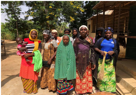
DTS groep bestaat uit vrouwen van voorgangers.

Het budget van deze vorm van DTS is uiteraard anders dan een DTS waarbij de deelnemers 3 maanden intern zijn en 3 maanden naar elders vertrekken voor hun praktijk. Vaak deden de deelnemers hun praktijkdeel in hun eigen dorpen, zodat de kosten beperkt bleven. De 8 maanden intern van de huidige opleiding heeft vooral als gevolg dat de onkosten voor voeding een stuk hoger zijn. Behalve de gift van een fonds in Nederland waren we daarom ook dankbaar voor de gift van LINK (Niger/VS). Daarnaast moeten we ook vermelden dat verschillende voorgangers een bijdrage in natura gaven (rijst, gierst, bonen).