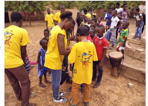
Tijdens de training in Ouagadougou.