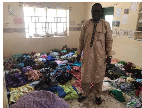
In verband met de grote armoede deelden we kleding uit op Centre Caleb.