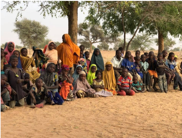
Beelden van kids-club van Quartier libre in Yaran Idi.