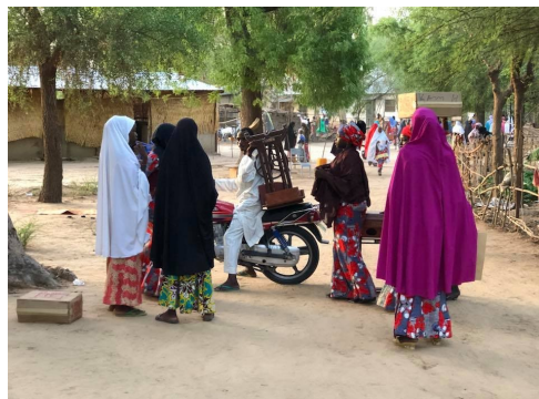
Met de naaimachine naar huis.