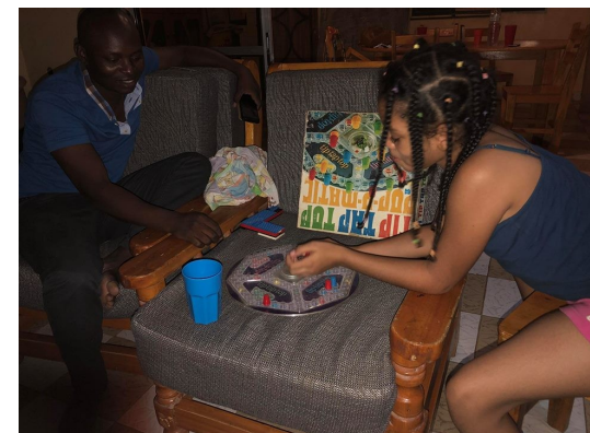
Phobé vindt het best lastig zich zelf bezig te houden zonder haar broer.