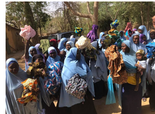
Lappen stof voor de eerste naaiopdracht.