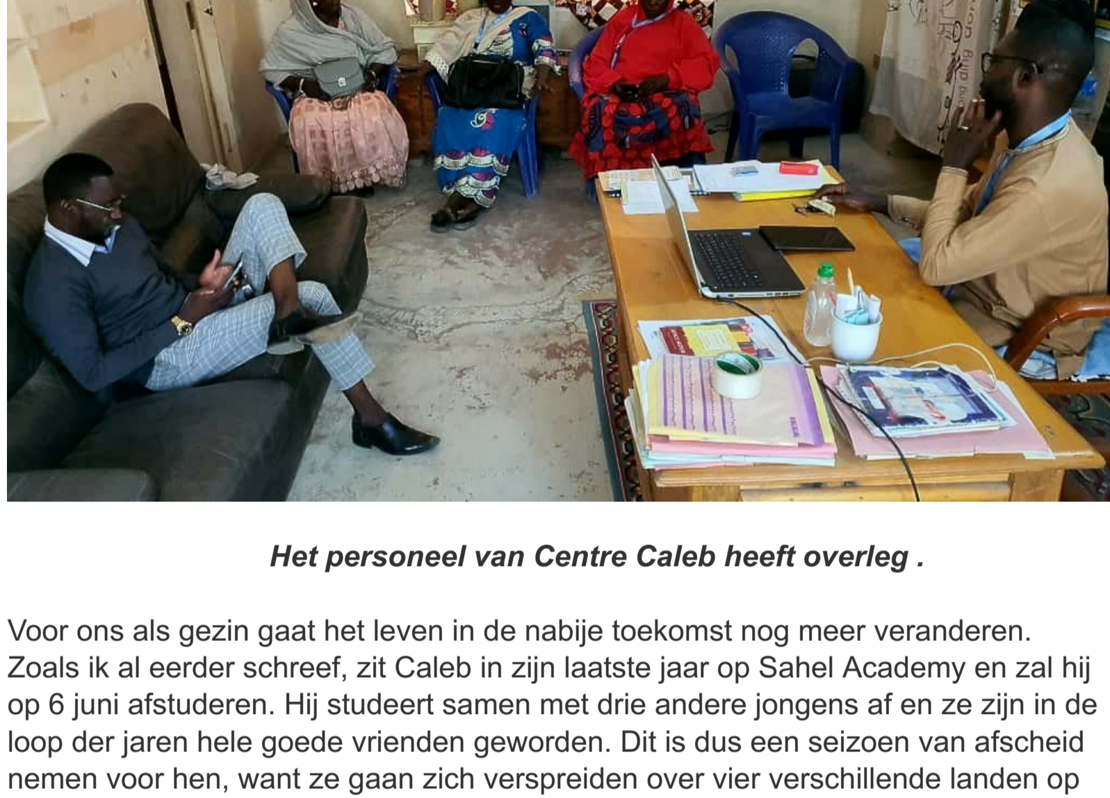
Het personeel van Centre Caleb heeft overleg.